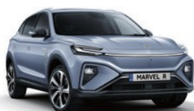
● Prism Blue (de série)