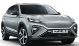
● Beton Grey (en option gratuite)