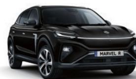
● Pebble Black (en option gratuite)