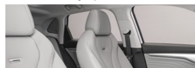
Intérieur gris : sièges partiellement en cuir Bader (en option gratuite)