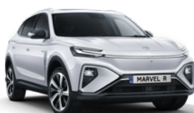
● Cumulus White (en option gratuite)