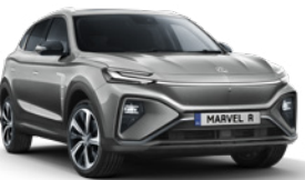
● Night Watch Grey (en option gratuite)