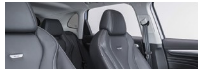
Intérieur noir : sièges partiellement en cuir Bader