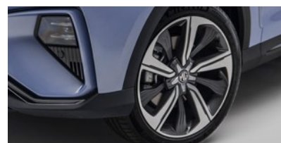
Jantes en alliage 19" - Luxury/Performance